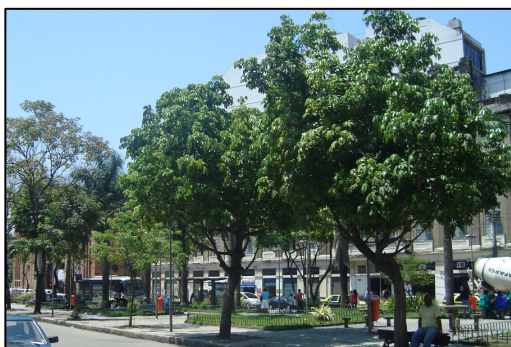
Praça localizada na Av. Barão de Tefé.