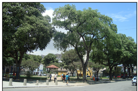
Visão geral da Praça Coronel Assumpção.