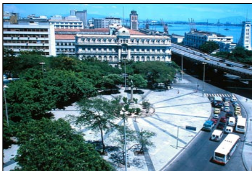
Visão geral da Praça Mauá

Também se verifica a utilização de espaços como “Praça seca”, que são espaço como Largos históricos ou espaços que suportam intensa circulação de pedestres, como por exemplo a Praça Mauá, a Praça General Pedra, a Praça Noronha Santos, a Praça Procópio Ferreira, Praça Santo Cristo, entre outras.