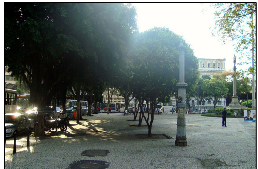
Detalhe Praça Mauá