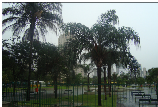
Praça Procópio Ferreira.