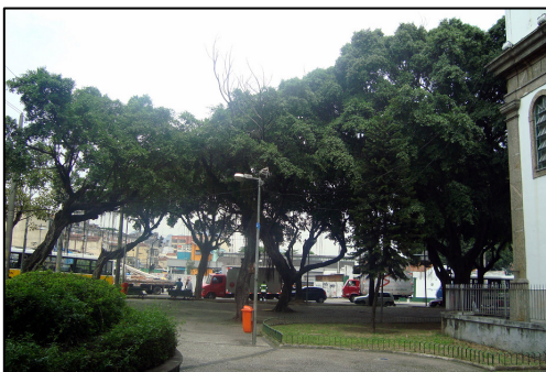
Praça Santo Cristo.