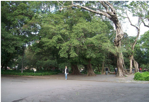
Campo de Santana

Na área da Operação Urbana, e em áreas contíguas verificamos a utilização de espaços como “Praça-jardim”, que são espaços nos quais a contemplação da formação vegetal e a existência de áreas verdes são priorizadas, como por exemplo o Parque Vila Formosa, no morro do Pinto, e a Praça da República, com os jardins do Campo de Santana, grande passeio público arborizado e urbanizado no início do século XIX.