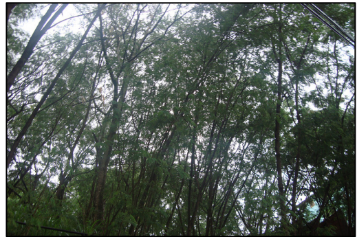
Vista Parque Vila Formosa

Também se verifica a utilização de espaços como “Praça seca”, que são espaço como Largos históricos ou espaços que suportam intensa circulação de pedestres, como por exemplo a Praça Mauá, a Praça General Pedra, a Praça Noronha Santos, a Praça Procópio Ferreira, Praça Santo Cristo, entre outras.